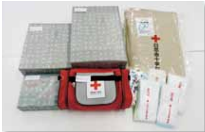
火災等の災害時に日本赤十字社から救援物資をお届けしています。

日本赤十字社の募金は、火災等で被災されたご家族への救援物資の配給や、市民の皆さんを対象とした救急法・心肺蘇生法(AED)講習会の開催、また、赤十字奉仕団による一人暮らし高齢者宅への慰問活動や献血事業への協力等、地域に応じた赤十字活動に活かされています。