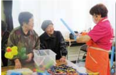
ふれあい・いきいきサロンの様子 ボランティアグループの方々とバルーンアートを楽しんでいます。

社会福祉協議会への会費は、ふれあい・いきいきサロン活動やケアネット活動を中心とした地域での生活を支える福祉活動の推進に活かされるほか、市内 21 地区への地域福祉コーディネーター