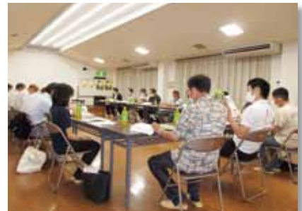
各地区でのミニ集会の様子

犯罪や非行のない明るい地域社会を築くため、砺波保護区保護司会が毎年 7 月に行なう「社会を明るくする運動」や市内各地区それぞれの実情に即した非行問題等を話し合う「ミニ集会」の実施等、市内の犯罪予防と青少年の健全育成活動に活かされています。(活動の詳細は 24 ページを参照ください)