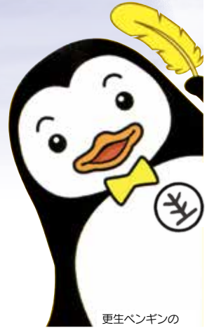
更生ペンギンの ホゴちゃん