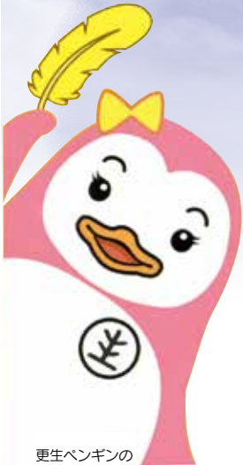
更生ペンギンの サラちゃん