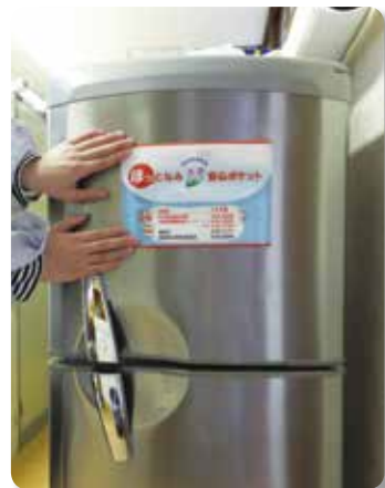
③万一に備えて！冷蔵庫に貼付