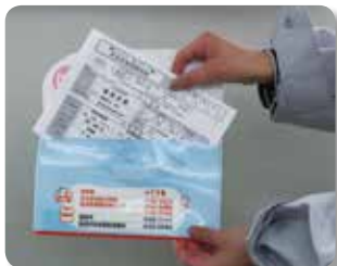
②家族全員の用紙を安心ポケットに