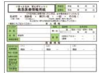
①救急医療情報用紙を記入

記入した「救急医療情報用紙」を「安心ポケット」に入れて冷蔵庫に貼り付けて、緊急時に備えてください。また、記入した内容は定期的に見直し、常に新しい情報にしておいてください。