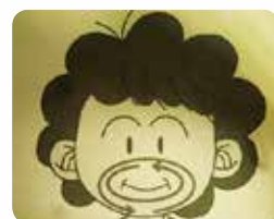
口を閉じて歯茎の周りを 舌で回します

南部デイサービスセンターでは、利用者の皆様にいつまでも美味しく食事をしていただき、誤嚥による肺炎が起らないよう、昼食前の口腔体操に力を入れています。