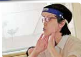
顎の下を指3本で 押し上げます