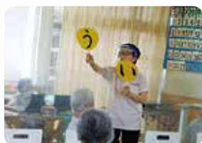
「うー」、「いー」と5回 発音します