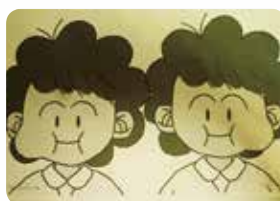
舌で頬を強く押します