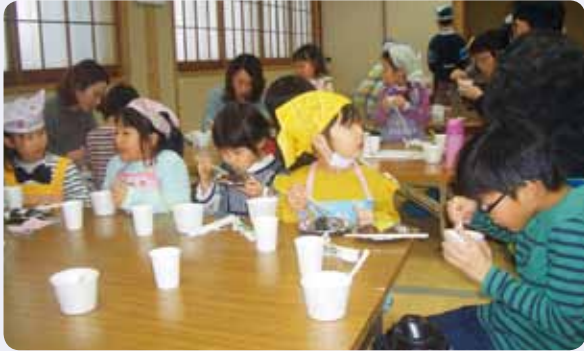
令和2年2月のびのび広場

高波地区福祉推進協議会では、「住民の参加・参画による地域福祉活動の推進」をモットーに、ともに支え合い助け合うことで、住民同士のつながりを強め、地域福祉の輪を広げる活動を行っています。自治会や老人クラブ等、地区内の諸団体からなる役員が「福祉推進部会」「ふれあい部会」「ボランティア部会」に分かれ、研修会や見学会の開催、ケアネット活動の推進、園児や児童と高齢者の世代間交流、幼稚園の花壇作り等の地域の美化活動を実施しています。また、「広報ささえあい」の発行や、「福祉便利ポスター」を全戸配布することで、福祉情報の共有につなげています。みんなが安心・安全に暮らせる地域を目指し、3つの部会が中心となり活動に取り組んでいます。