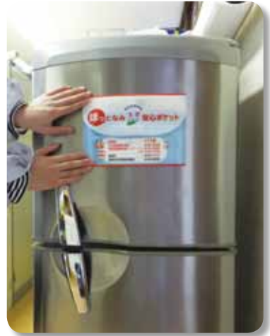
③万が一に備えて！冷蔵庫に貼付

記入した「救急医療情報用紙」を「安心ポケット」に入れ、冷蔵庫に貼り付けて、緊急時に備えてください。また、記入した内容は、定期的に見直し、常に新しい情報にしておいてください。