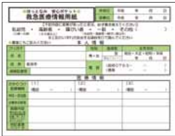
①救急医療情報用紙を記入