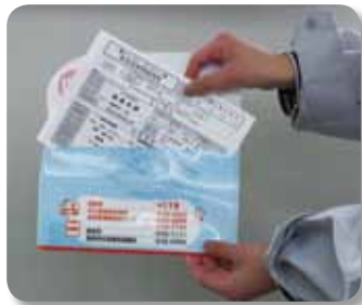
②家族全員の用紙を安心ポケットに