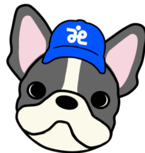
ふれあい号マスコット ふれんチブルのあいくん

ふれあい号は、車いすの方や移動手段を持たない高齢者の方の外出支援を目的とした車両です。